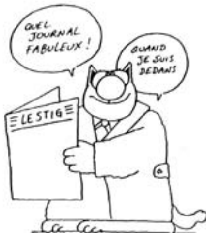
La période "Chat" avec Véronique Humbel-Renaud

C'est grâce à vous tous, lecteurs, coureurs, champions, fans qu'il vit. Vous savez, c'est aussi un peu une commère... il aime bien recevoir des cartes postales, des histoires drôles, des photos, commentaires de courses... même un coup de gueule, pourquoi